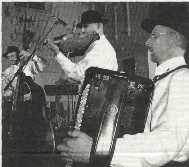
W ubiegłym roku włodawską publiczność oczarował swoją muzyką zespół „Kroke” z Krakowa. Do grona ich fanów zalicza się między innymi amerykański reżyser Steven Spielberg