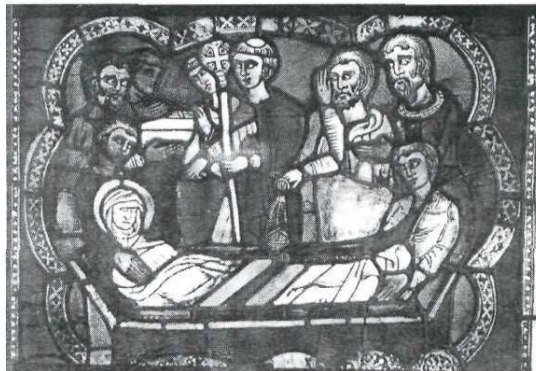
Złożenie do grobu św. Szczepana – jedna z dwu kwater tzw. adampolskich witraży znajdujących się w zbiorach włodawskiego muzeum

Wszystkie festiwalowe wieczory we włodawskich świątyniach, organizowane przez Muzeum Pojezierza Łęczyńsko-Włodawskiego, przy finansowym wsparciu Ministerstwa Kultury i Sztuki, Fundacji im. Stefana Batorego oraz Urzędu Miejskiego we Włodawie, będą rozpoczynać się o godz. 17. Szczegółowe informacje o progra-