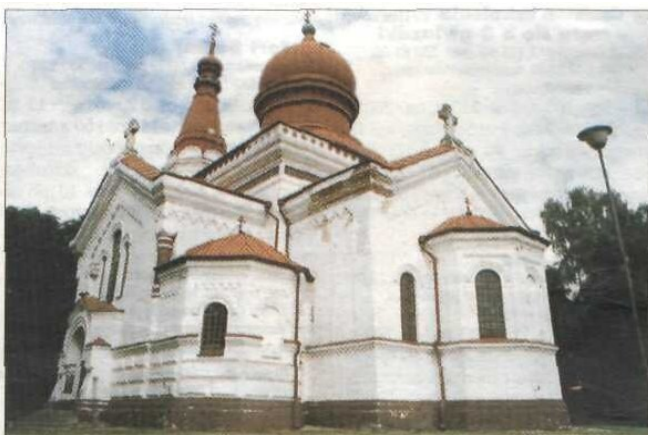
Cerkiew prawosławna we Włodawie

Przy ul. Czerwonego Krzyża znajduje się zespół obiektów użytkowanych przez Muzeum Pojezierza Łęczyńsko-Włodawskiego. Centralne miejsce zajmuje w nim późnobarokowa synagoga wystawiona w latach 1764-74 – jedna z cenniejszych