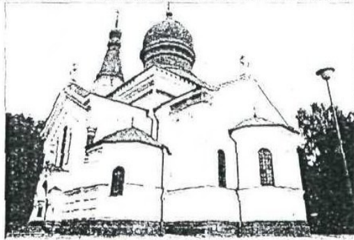
Cerkiew prawosławna we Włocławku

W 1740 r. dobra włocławskie odkupił podskarbi wielki litewski Jan Jerzy Fleming, który utworzył na Bugu jeden z ważniejszych wójtów potopu rzecznych. Po III rozbiorze w 1795 r. Włocławka przypadła Austriakom, a w II poł. XIX w. przejął ją rząd pruski. W okolicy miały miejsce dramatyczne wydarzenia w czasie powstania styczniowego 1863 r. (na starym cmentarzu przy ul. J. Piłsudskiego znajduje się po-